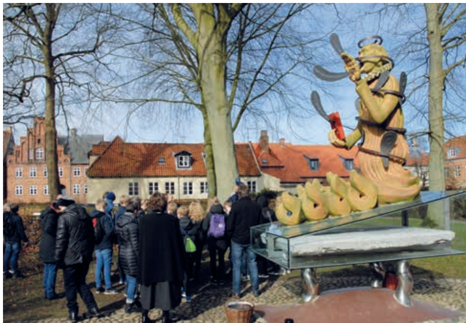
Med konfirmanderne i Hans Tausens Minde