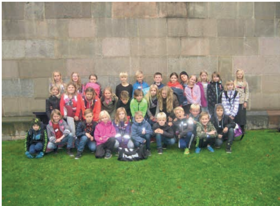
Årets juniorkonfirmander på besøg i Domkirken