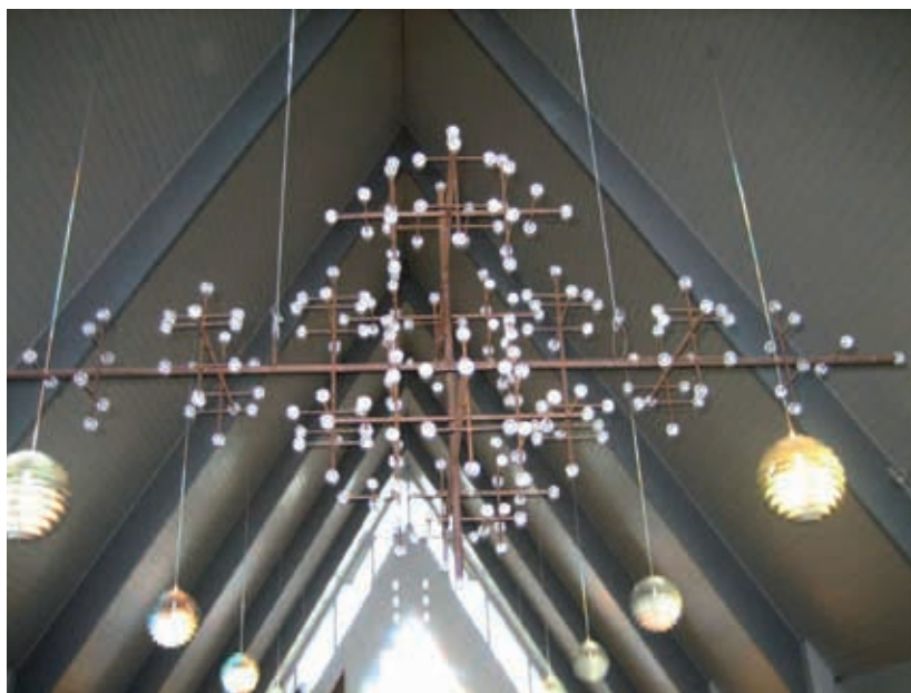
Korsophænget en solskinsdag