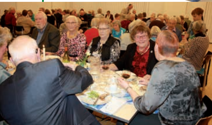
Når snakken går