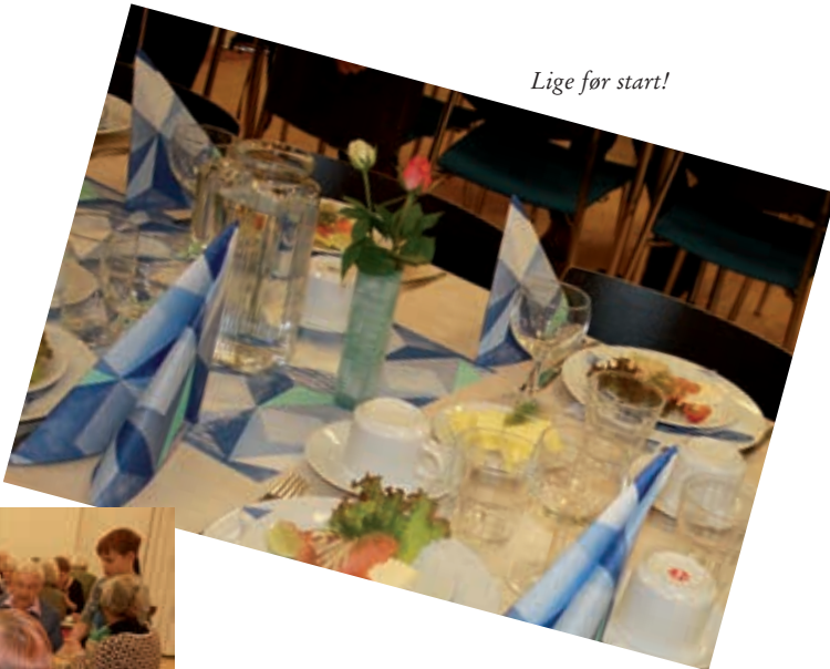
Lige før start!