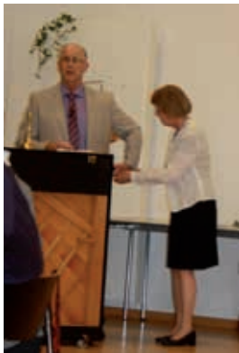
Formanden byder velkommen

En fredag aften på den sidste dag i oktober havde menighedsrådet inviteret alle frivillige medarbejdere til festaften i kirkens lokaler.