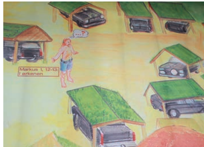
Jesus i ørkenen.