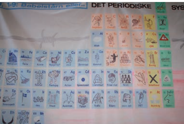
Bemærk elementernes indhold.