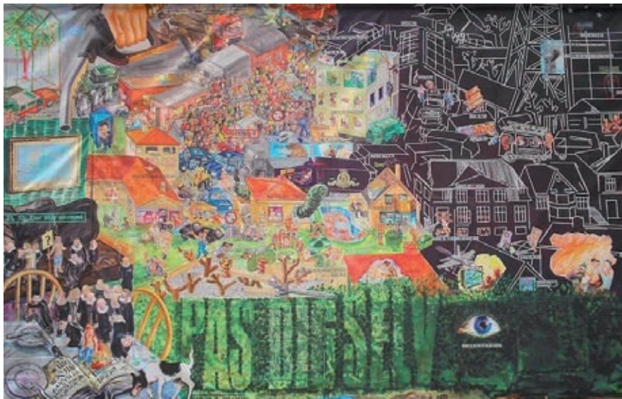
Udsnit af Erik Hagens Esbjerg Evangeliet