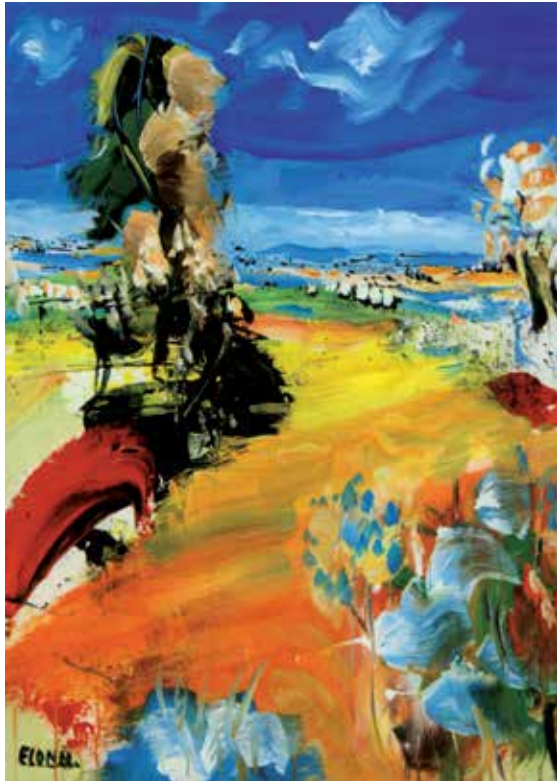
Et af Elonn Agerup's malerier.