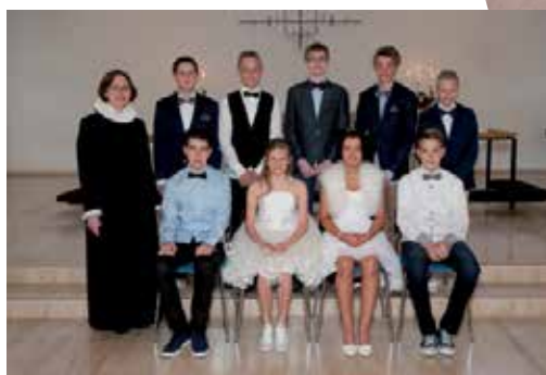
Konfirmanderne 2013 – se også billederne i stor størrelse på www.vestervang-viborg.dk