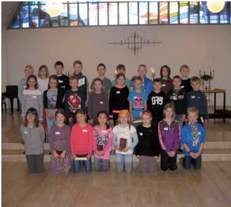
Juniorkonfirmander foråret 2013