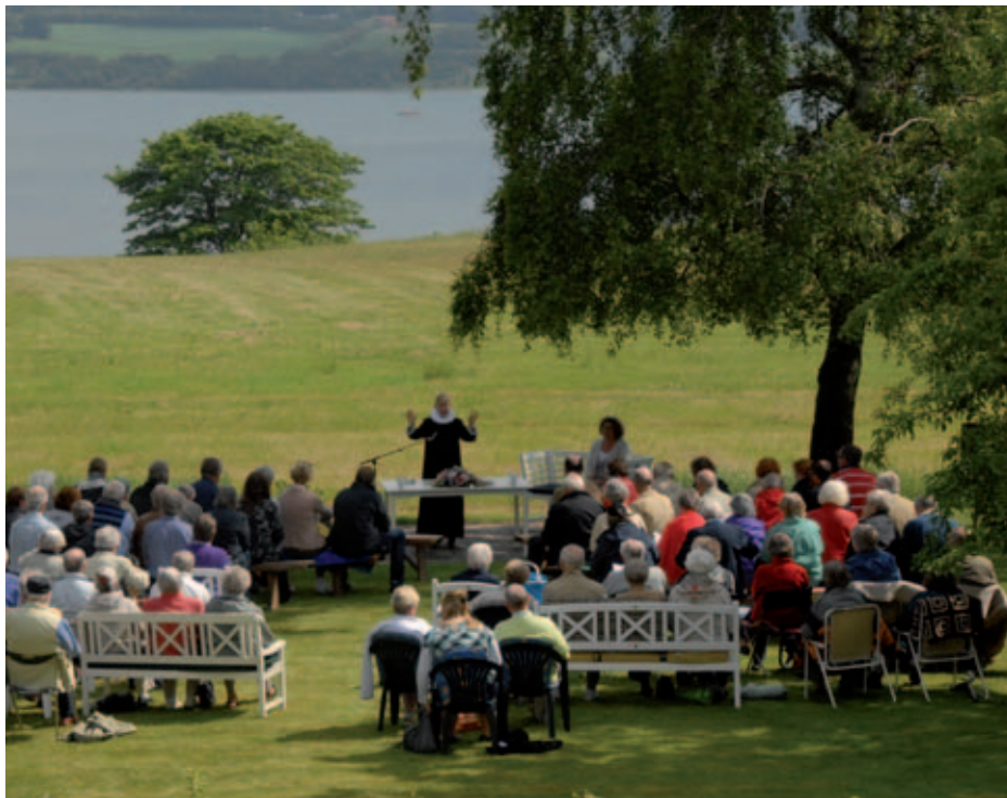
Kristi Himmelfartsgudstjeneste, 2011, ved Knudby Præstegård