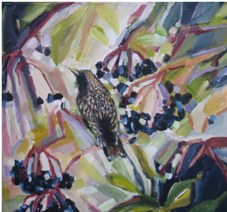
Majken Bilgrav Sørensen: Stær i Hyldeblomst