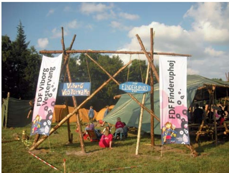
FDF Vestervangs indgangsportal på den store landslejr ved Julsø