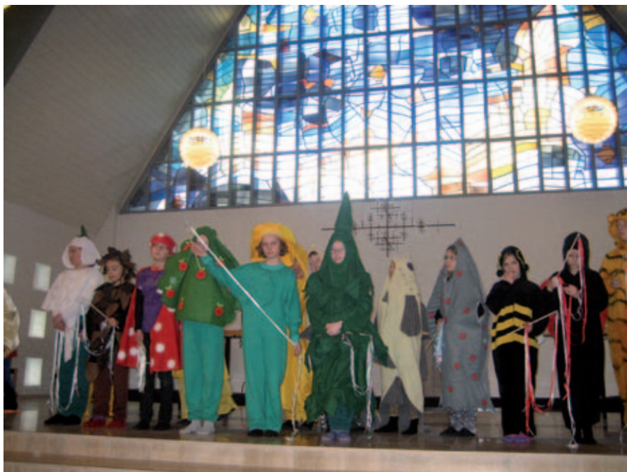
Juniorkonfirmanderne opfører skabelsen