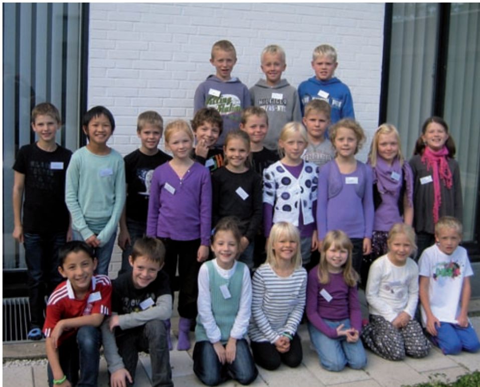
Kirkens nye generation: Efterårets hold af juniorkonfirmander fra Vestre Skole og 3. x på Vestervang Skole