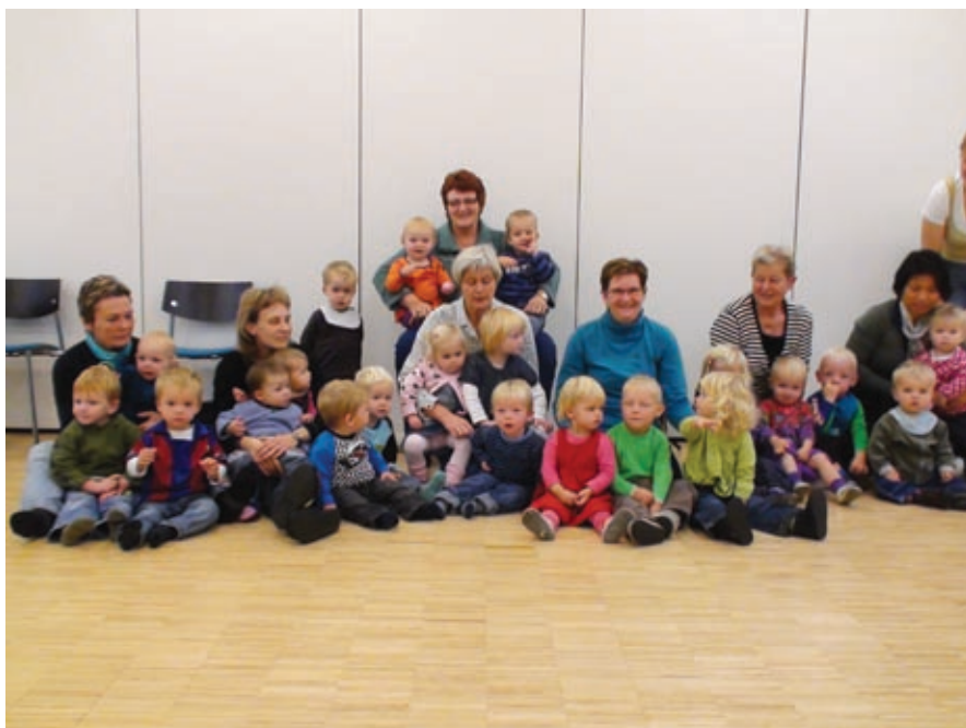
Glade børn der er klar til „Kom og syng!“