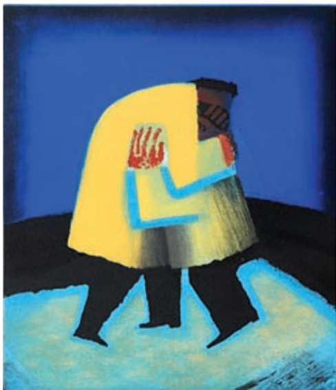
Hjemkomst, radering, 2008