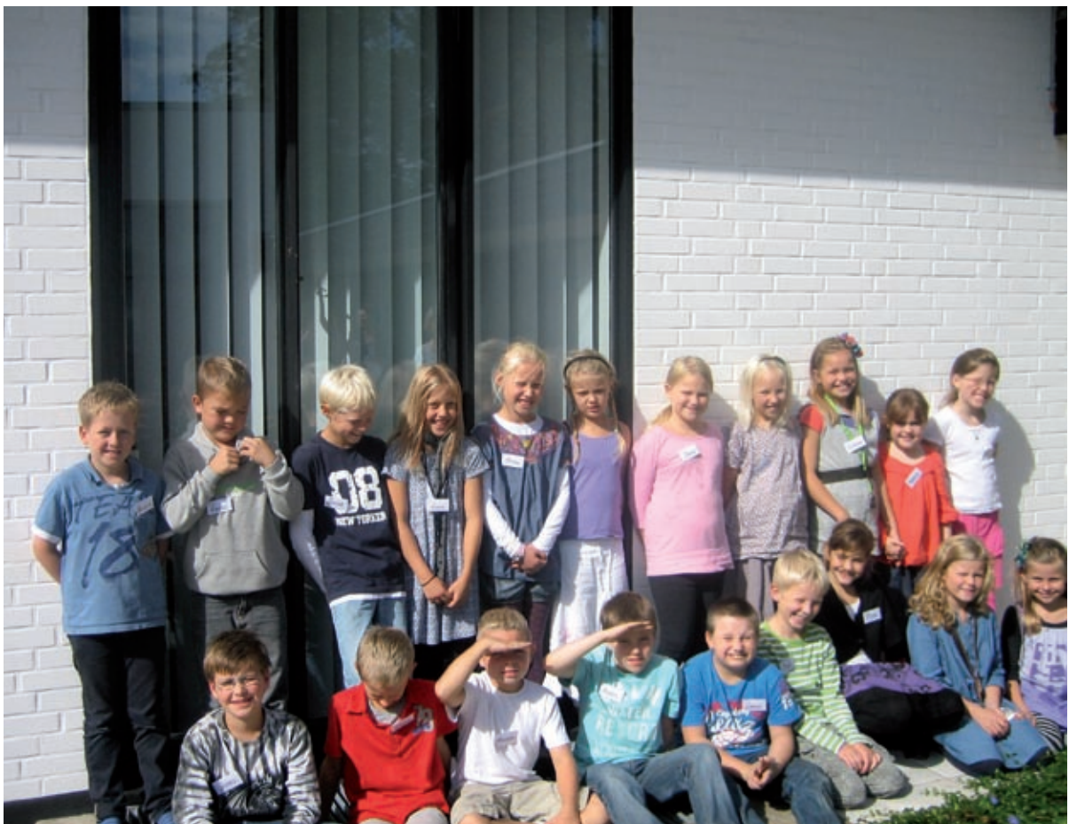
22 børn fra Vestre Skoles 3. klasser og 3.x på Vestervang Skole har gået til juniorkonfirmandundervisning i Vestervang Kirke.

Jeg er gift og har 2 børn. Jeg glæder mig til at skulle virke som præst i Vestervang.