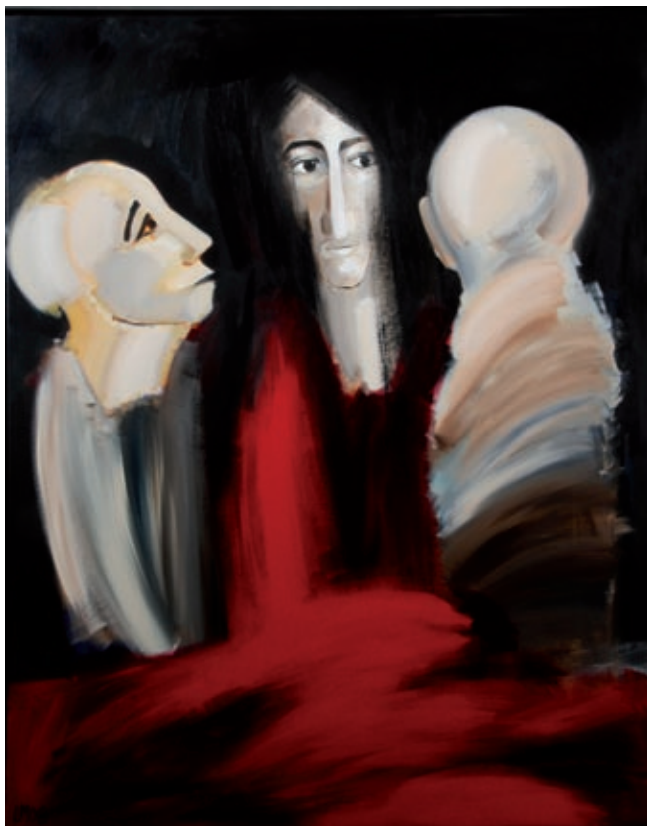
Emmaus af Lene Melchiorsen