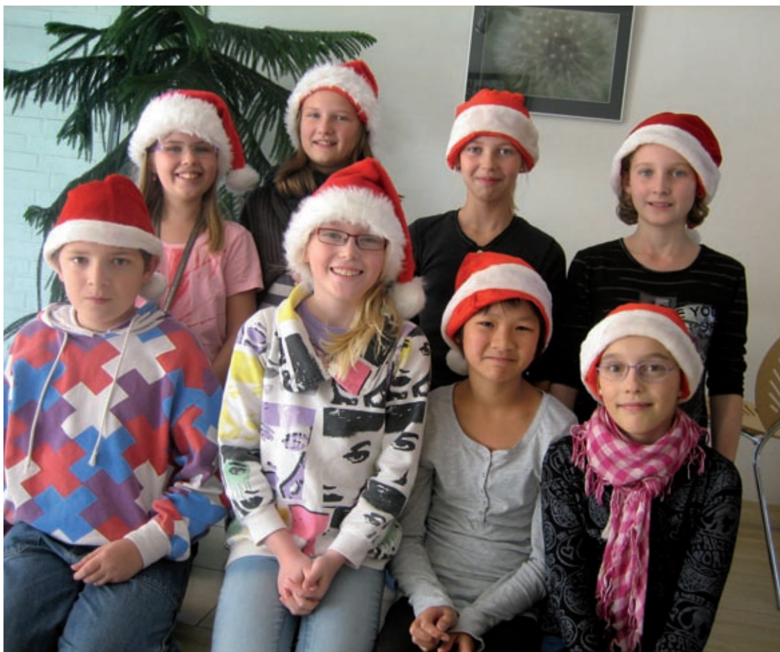
Juniorclubbernes hold fra 4. klasse, der er kommet med gode udsagn om jul.